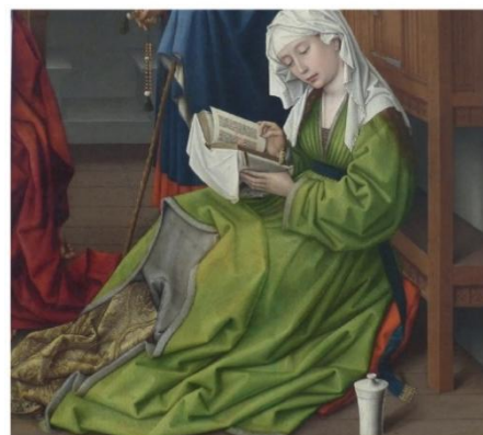
Rogier van der Weyden (1399–1464), Lesende Maria Magdalena

Am 22. Juli hat Maria Magdalena ihr Fest. In der Bibel begegnet sie uns als eine der Jüngerinnen, die Jesus nachfolgen. Und sie wird zur Erstzeugin von Ostern, zur „Apostelin der Apostel“, weil sie den Jüngern die Botschaft von der Auferstehung Jesu verkündet.