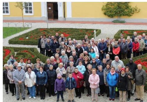
Gruppenfoto von der 35. Pfarrwallfahrt nach Landshut.

Kath. Kirchenstiftung Beratzhausen DE 74 7506 9061 0000 5214 26 Kennwort: Pfarrwallfahrt Passau