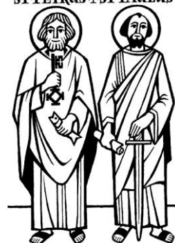
ST-PETRUS + ST-PAULUS